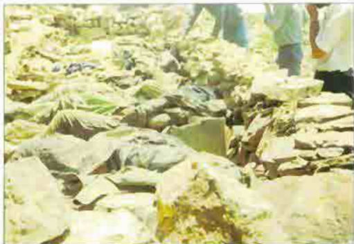
Mass killings resulting from aerial bombardment of Turkish warplanes