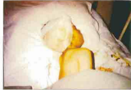
Kürdistan'daki kirlı savařta suçsuz ve gúnahsız çocuklarda nasıplerını aldı.