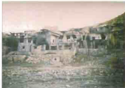
The only inhabitants left behind in ruined villages : a child and a rooster.