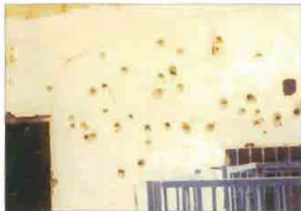
Kürdistan'da taranan ve top ateşine tutulan evler, altta ise eşyaları tahrip edilen köyüler görmekte.