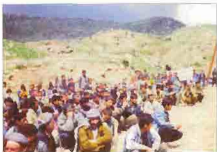
Tens of thousands of Kurds from Turkey sought refuge in Southern Kurdistan to escape the brutality of the Turkish army.