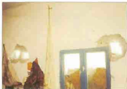
In Kurdistan, homes are raked with gun fire and mortars: as shown below, belongings are destroyed, and homes razed to the ground.