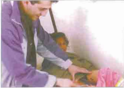
Innocent children suffer permanently from the dirty war in Kurdistan.