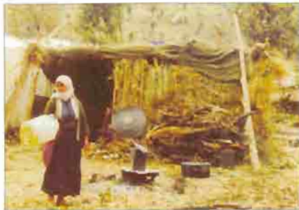
Onbinlerce Kürt Türk devletinin vahşetinden kaçarak Güney Kürdistan'a sığınmak zorunda kaldı...