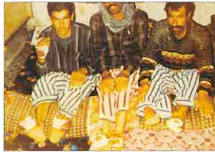
Kurdish villagers tortured savagely by Turkish oppressors.