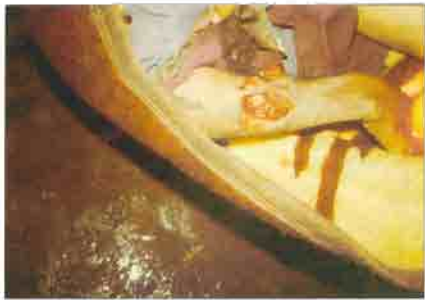
Türk egemenlerinin mazlum Kürt halkına uyguladığı vahşi işkence yöntemlerinden sadece birkaç örnek...