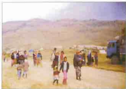
The 15 year old war in Kurdistan has forced more than four million Kurds to flee from their own lands.