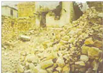
Altta evleri tahrip edilen bir çocuk ve horoz görülyon.