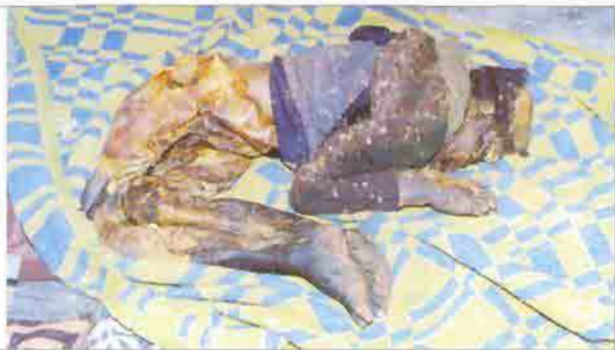
Kimyasal silahlarla katledilerek parçalanmış ARGK Gerillaları