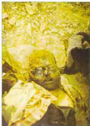
The charred bodies of Kurdish guerillas testify the use of chemical weapons by the Turkish army