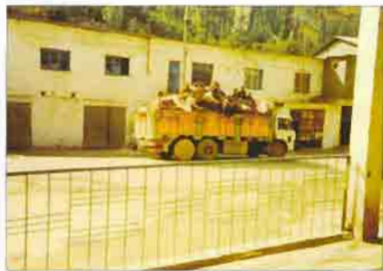
Son onbeş yıldan beri 4 milyondan fazla Kürt kendi topraklarından göçertildi